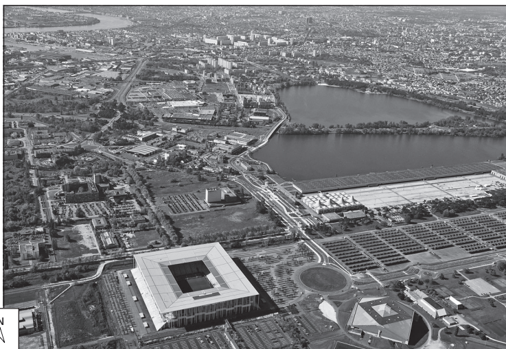
Doc. 2 Le quartier de Bordeaux-Lac, sur la rive gauche de la Garonne, au nord de la ville.