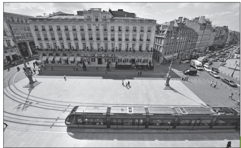
Doc. 6 Le tramway à Bordeaux.