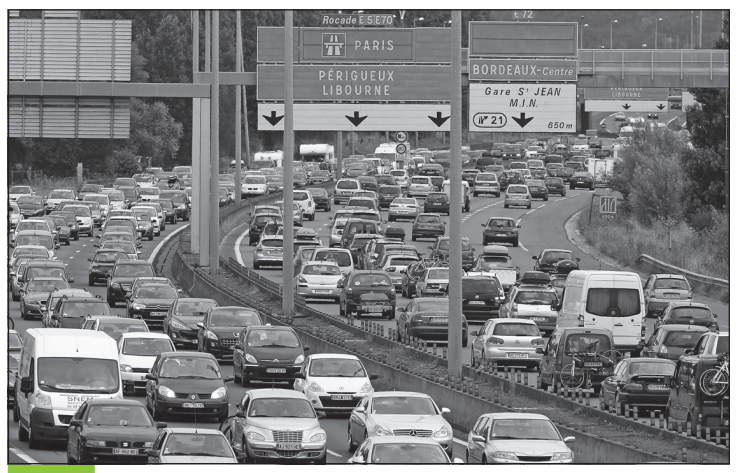
Doc. 5 Les embouteillages à Bordeaux.

D'après un article de Sud-Ouest , 29 octobre 2011.