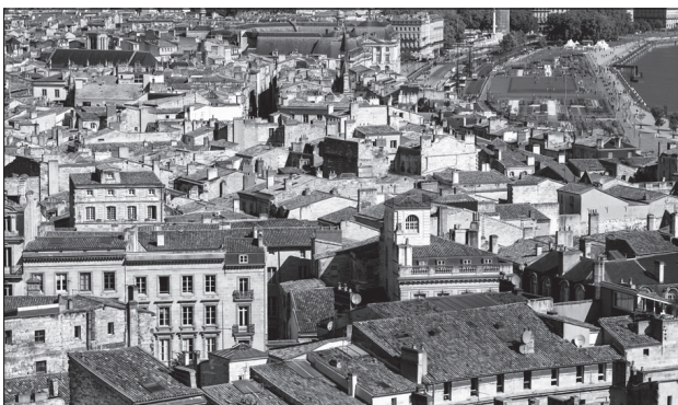
Doc. 1 Le quartier du centre-ville.