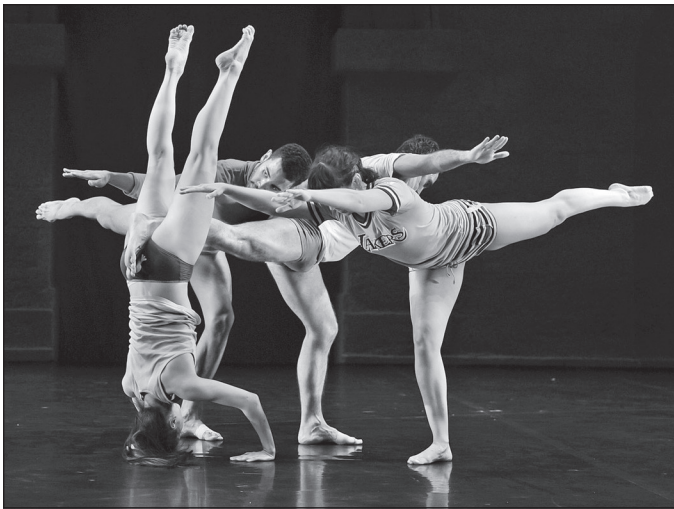
Doc. 1 Danseurs et danseuses, festival de danse.