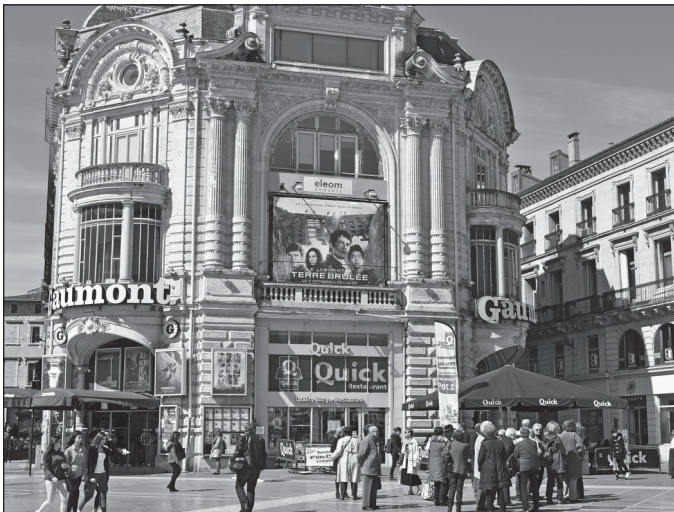
Doc. 3 Un cinéma.