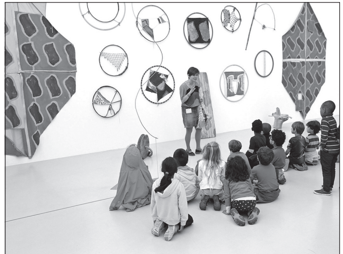
Doc. 4 Une exposition au musée Fabre.