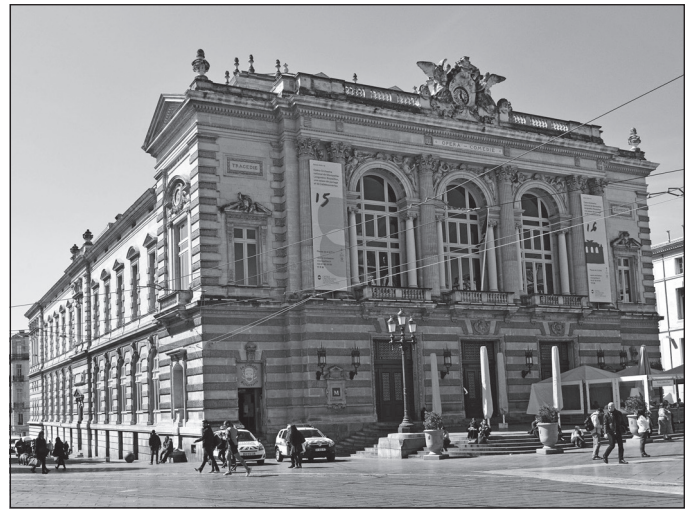
Doc. 2 Le théâtre municipal.