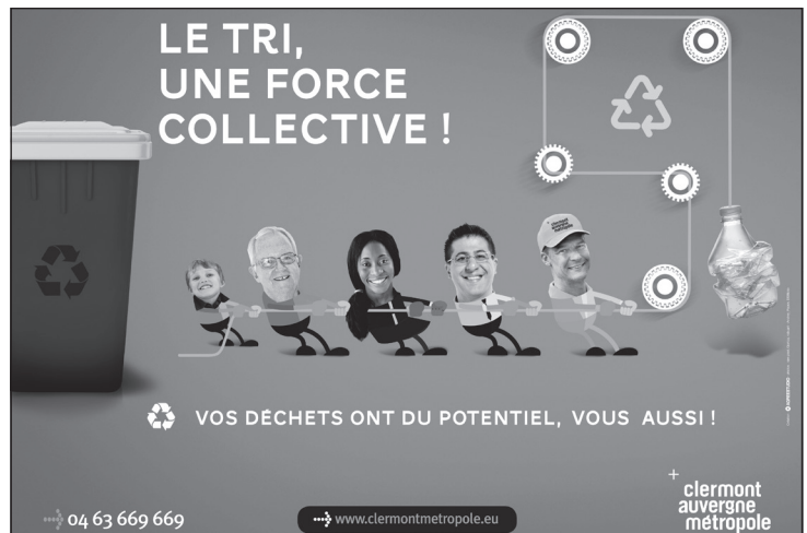
Doc. 2 Affiche pour le tri sélectif à Clermont-Ferrand.

1. Colorie dans le document 1 : en vert les déchets recyclés, en jaune les déchets biodégradables, en rouge les déchets non recyclés.