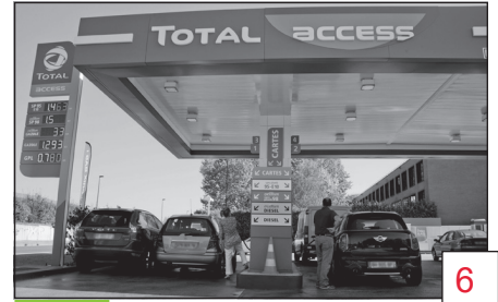
Doc. 3 Une station essence à Lyon.