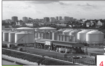
Doc. 2 Un dépôt pétrolier à Gennevilliers.