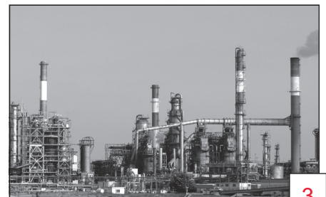
Doc. 6 Une raffinerie à Donges (Pays-de-la-Loire).