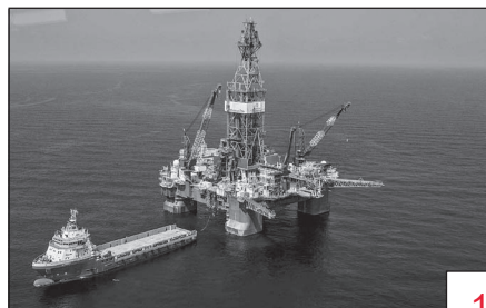
Doc. 5 Un gisement off-shore en Afrique.