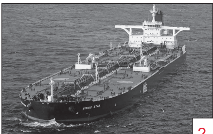
Doc. 4 Un tanker sur l'océan Atlantique.