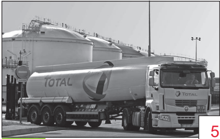
Doc. 1 Un camion-citerne à la sortie du dépôt pétrolier de Gennevilliers.