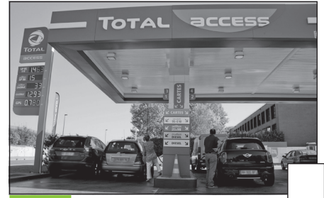
Doc. 3 Une station essence à Lyon.