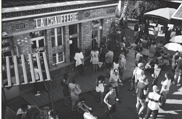
Doc. 6 La chaufferie est un espace convivial d'échanges.