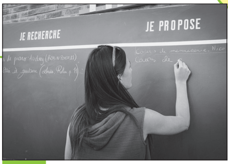
Doc. 5 Aux Grands voisins, l'entraide et le troc font partie du quotidien.