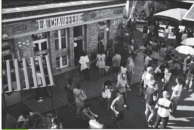
Doc. 6 La chaufferie est un espace convivial d'échanges.