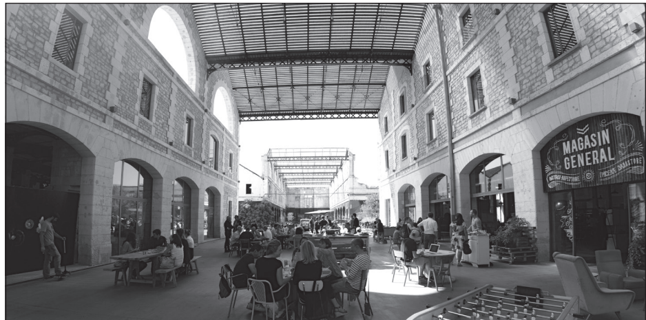
Doc. 2 Le restaurant du projet Darwin.

À Darwin, tout le monde peut venir manger au restaurant, acheter des produits biologiques, faire réparer ou acheter un vélo, pratiquer le skate ou louer un bureau pour installer sa petite entreprise.